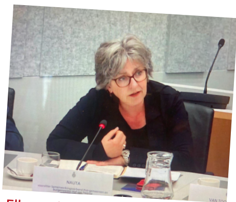
Elke regio telt! opent de ogen van Haagse politiek

klik op een van de polaroids om direct naar het artikel te gaan.