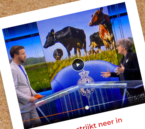
EenVandaag strijkt neer in Nieuw Ballinge