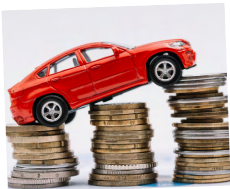
Rekeningrijden: gedifferentieerd tarief voor het platteland